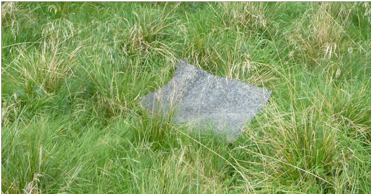
Abb. 7: Reptilienquadrat als künstliches Habitatelement (Beispiel).