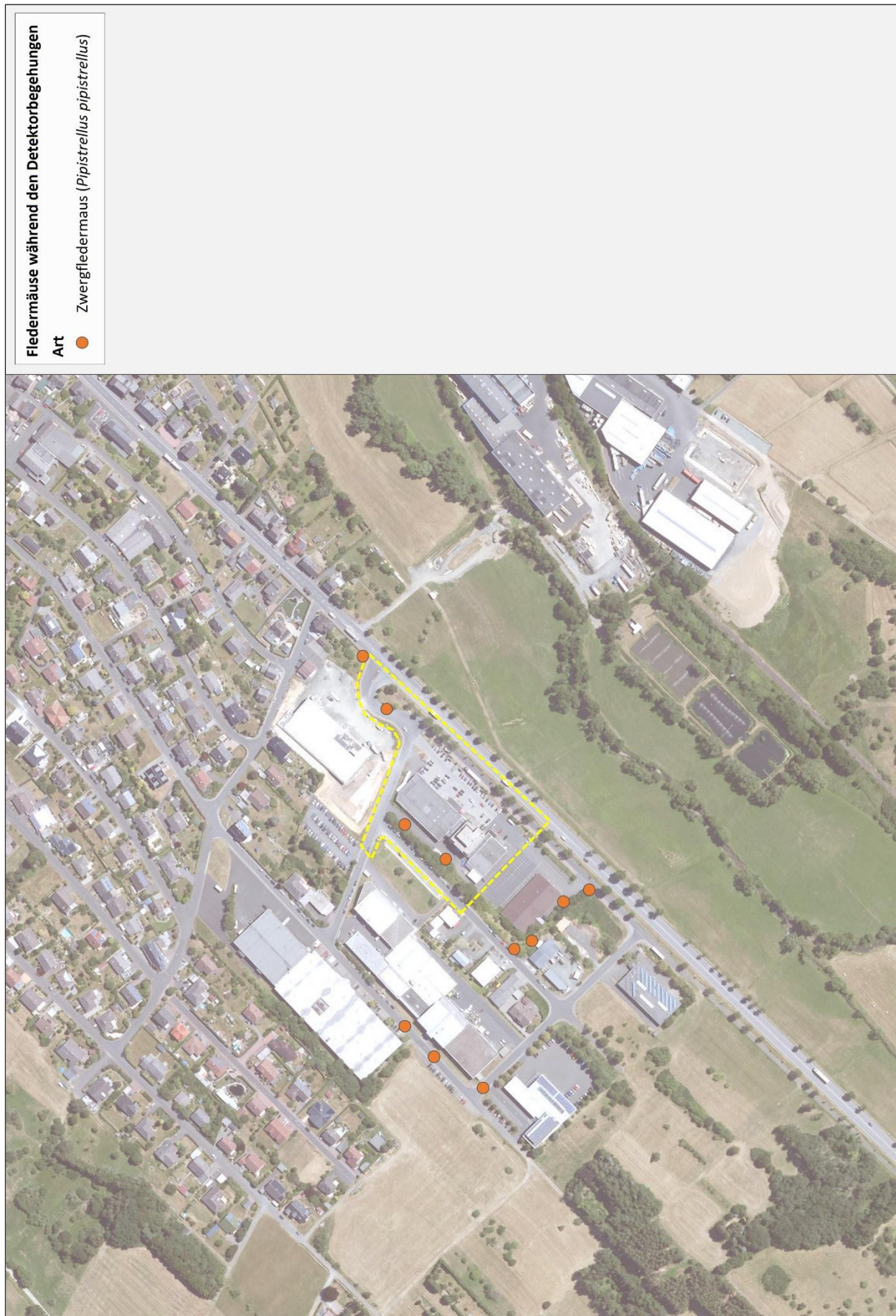
Abb. 5: Fledermäuse während der Detektorbegehungen im Untersuchungsraum (Bildquelle: Hessisches Ministerium für Umwelt, Klimaschutz, Landwirtschaft und Verbraucherschutz, aus natureg.hessen.de, 11/2023).