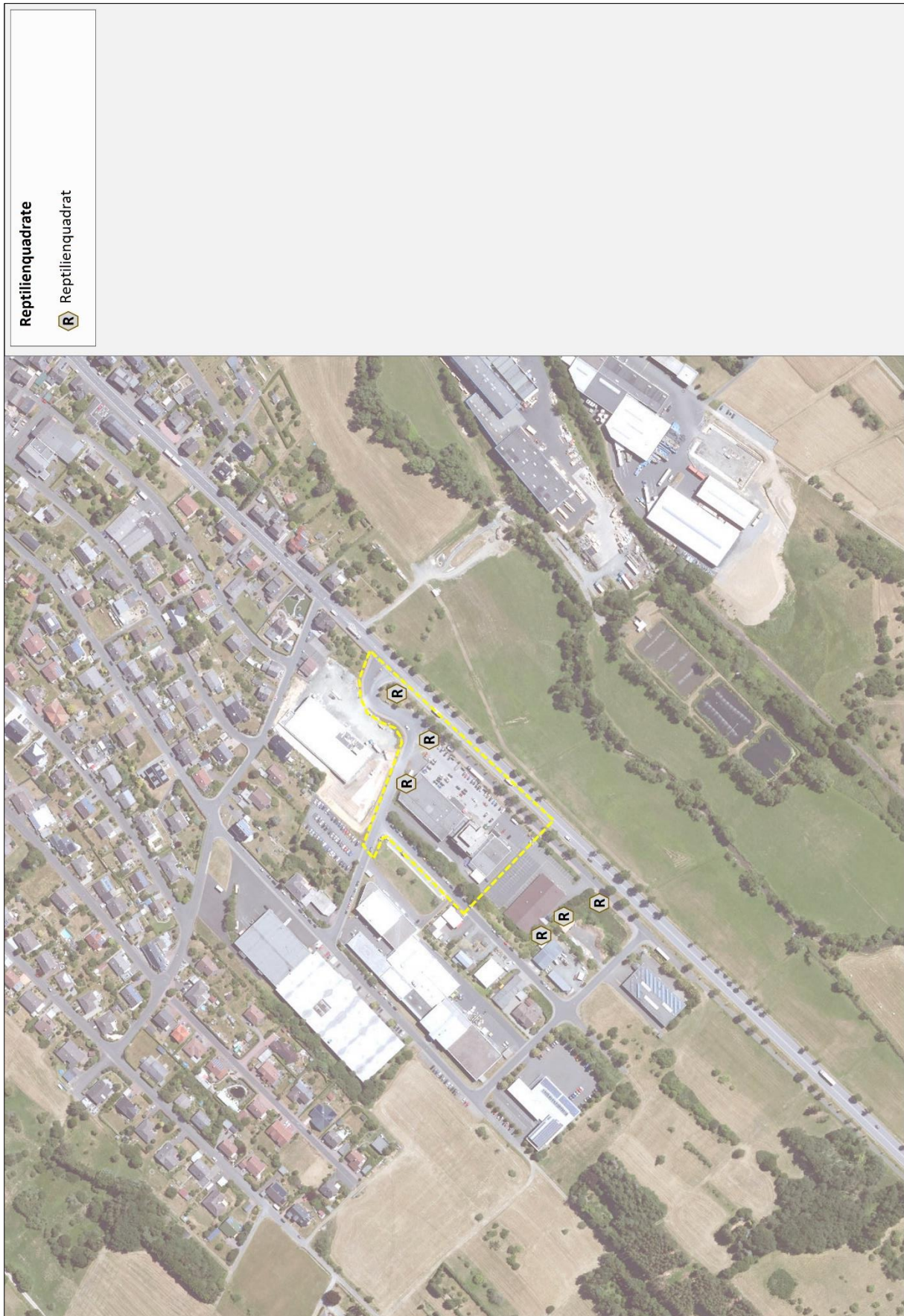
Abb. 6: Reptilienquadrate im Untersuchungsraum 2023.