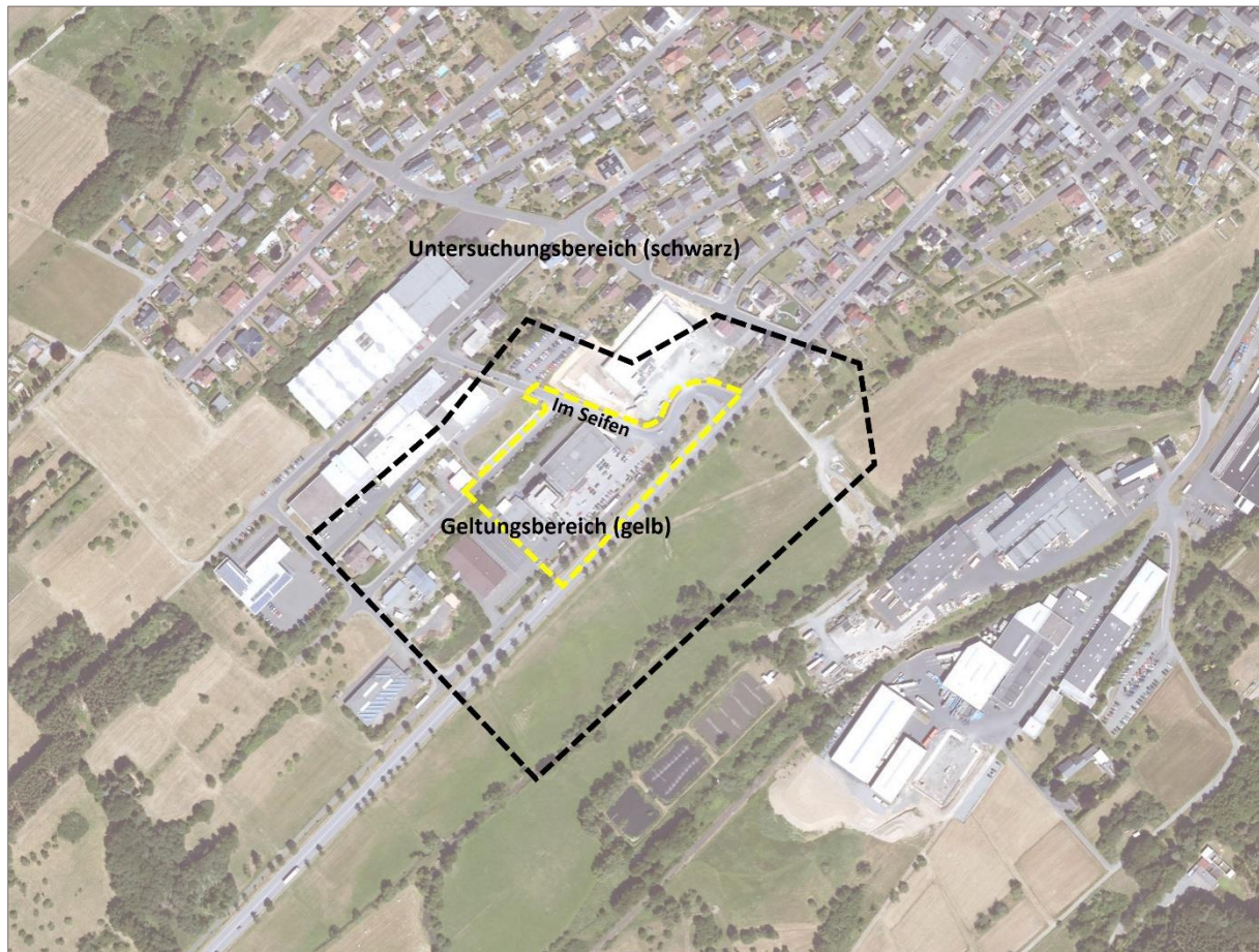
Abb. 1: Abgrenzung des Geltungsbereichs (gelb) sowie des Untersuchungsbereichs (schwarz) zum Bebauungsplan „Im Seifen“, 1. Änderung; Gemeinde Eschenburg, Ortsteil Wissenbach (Bildquelle: Hessisches Ministerium für Umwelt, Klimaschutz, Landwirtschaft und Verbraucherschutz, aus natureg.hessen.de, 11/2023).

Das vorliegende Gutachten verfolgt die in diesem Zusammenhang geforderte Überprüfung, ob durch die geplante Nutzung artenschutzrechtlich besonders zu prüfende Arten betroffen sind. Gegebenenfalls ist sicherzustellen, dass durch geeignete Maßnahmen keine Verbotstatbestände gemäß § 44 BNatSchG eintreten.