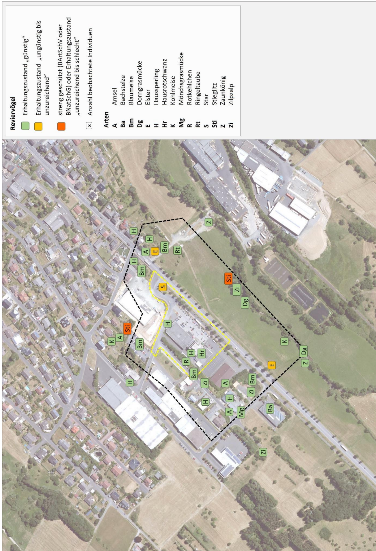
Abb. 3: Reviervogelarten im Geltungsbereich (gelb) und Untersuchungsraum (schwarz) 2024 (Bildquelle: Hessisches Ministerium für Umwelt, Klimaschutz, Landwirtschaft und Verbraucherschutz, aus natureg.hessen.de, 11/2023).