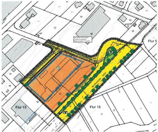
Planzeichnung des Entwurfs der 1. Änderung des Bebauungsplans „Im Seifen“

Zudem ist – erneut abweichend von der Zielrichtung des Aufstellungsbeschlusses – nunmehr wohl nur noch geplant, einen Vollsortimenter mit 1.700 m 2 Verkaufsfläche und einen Getränkemarkt mit 500 m 2 Verkaufsfläche – mithin insgesamt 2.200 m 2 Verkaufsfläche – (wieder) anzusiedeln; ein (weiterer) Lebensmitteldiscounter findet keine Erwähnung mehr.