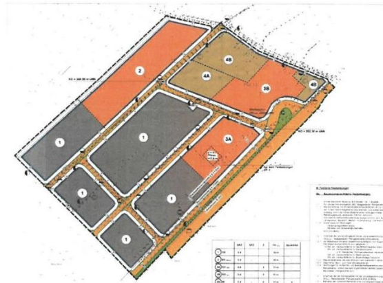
Planzeichnung des Bebauungsplans „Im Seifen“

Ausweislich des Aufstellungsbeschlusses verfolgte die Gemeinde Eschenburg mit der 1. Bebauungsplanänderung das Ziel, einen großflächigen Vollsortimenter mit 1.600 m 2 Verkaufsfläche sowie einen großflächigen Discounter mit 1.100 m 2 Verkaufsfläche (wieder) anzusiedeln. Gleichzeitig sollte das Planungsrecht für die Ansiedlung eines neuen Drogeriemarkts mit 800 m 2 Verkaufsfläche geschaffen werden. Auch das Grundstück unseres Lidl-Markts war noch in den (künftigen) Geltungsbereich der aufzustellenden Planänderung einbezogen, obwohl insoweit noch keine konkreten Planvorstellungen bestanden.