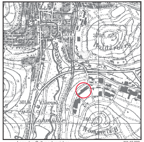
Lage des Geltungsbereiches M1:10.000

Die textlichen Festsetzungen werden nach der öffentlichen Auslegung eingefügt.